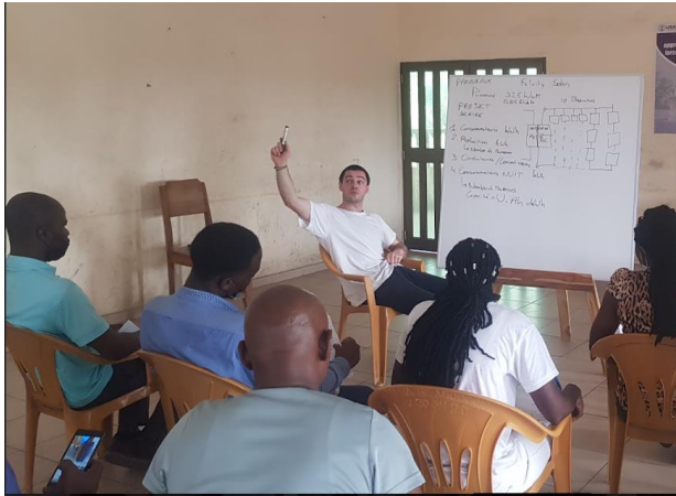
Figure 1: Atelier de formation des bénévoles